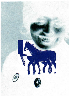
Ulrike Rosenbach „Postkartenobjekt“